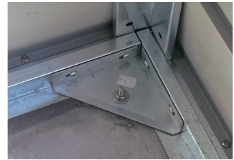
コーナーアンカーとガセット

ブロックフェンス際に製品を設置する場合、コーナー部分の排水を考慮して下さい。 製品内への雨水侵入を防ぐために、雨水路のスペースを空けて下さい。 基礎は左ページ[A]内高基礎を推奨しておりますが、[B]フラット基礎の場合はウッドフロア（オプション品）で床を上げて下さい。